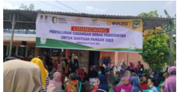
Launching Cadangan Pangan Pemerintah (Beras) Untuk Bantuan Pangan (Beras) Yang Dilakukan Pada Tanggal 14 April 2023 Di Kantor Pos Serbalawan Kecamatan Dolok Batu Nanggar Kabupaten Simalungun

Undang-undang Pangan Nomor 18 tahun 2012 mendefinisikan ketersediaan pangan sebagai kondisi tersedianya pangan dari hasil produksi dalam negeri dan cadangan pangan nasional serta impor apabila kedua sumber utama tidak dapat memenuhi kebutuhan. Produksi pangan adalah kegiatan atau proses menghasilkan, menyiapkan, mengolah, membuat, mengawetkan, mengemas, mengemas kembali, dan/atau mengubah bentuk Pangan. Sedangkan cadangan pangan nasional adalah persediaan pangan di seluruh wilayah Negara Kesatuan Republik Indonesia untuk konsumsi manusia dan untuk menghadapi masalah kekurangan pangan, gangguan pasokan dan harga, serta keadaan darurat. Penyediaan pangan diwujudkan untuk memenuhi kebutuhan dan konsumsi pangan bagi masyarakat, rumah tangga dan perseorangan secara berkelanjutan. Mayoritas bahan pangan yang diproduksi maupun didatangkan dari luar wilayah harus masuk terlebih dahulu ke pasar sebelum sampai ke rumah tangga. Oleh karena itu, selain kapasitas produksi pangan, keberadaan sarana dan prasarana penyedia pangan seperti pasar akan terkait erat dengan ketersediaan pangan di suatu wilayah.