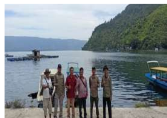
Kegiatan Bidang Perikanan Tahun 2023